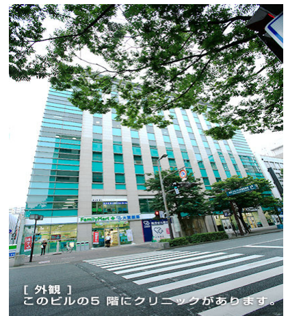
[外観] このビルの5階にクリニックがあります。

〈アクセス〉◎ 博多駅からタクシーで10分程 ◎ 地下鉄「中洲川端駅」から徒歩5分程