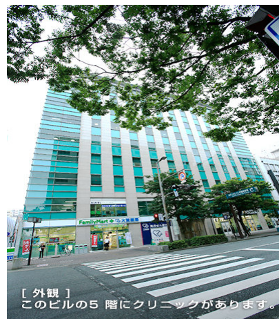
〔外観〕 このビル5階にクリニックがあります。

〈アクセス〉◎ 博多駅からタクシーで10分程 ◎ 地下鉄「中洲川端駅」から徒歩5分程