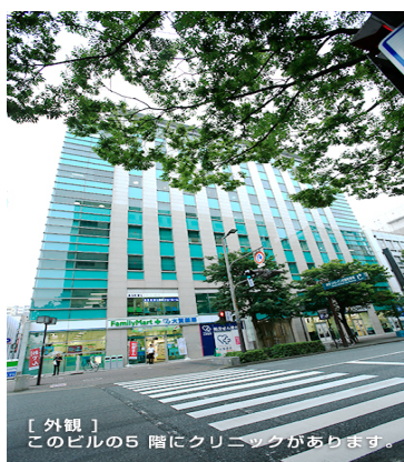
【外観】 このビル5階にクリニックがあります。